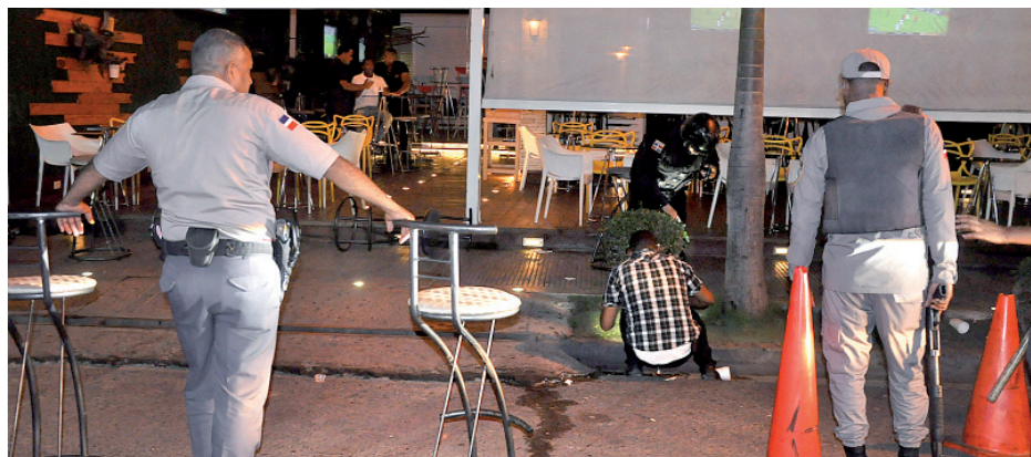
Policías buscan evidencias en el lugar donde ocurrió el incidente.

INCIDENTE. David Ortiz, expelotero de Grandes Ligas, se encuentra fuera de peligro tras haber sido herido de bala a las 9:45 de anoche y posteriormente sometido a una cirugía en la Clínica Abel González, de la avenida Abraham Lincoln.